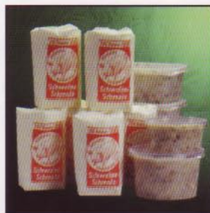
Fettauslassen ohne Rühren