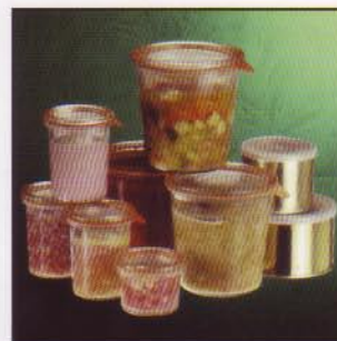
Sterilisieren von Konserven