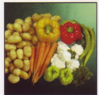
Druckgaren im Dampf