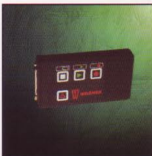
Datenrecorder zum Aufzeichnen von Sterilisationsprotokollen