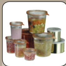
Sterilisieren von Konserven