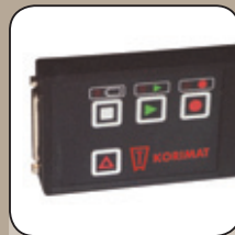
Datenrecorder zum Aufzeichnen von Sterilisationsprotokollen