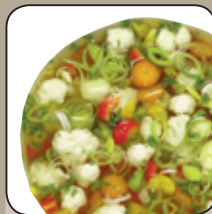
Schnellkochen von Suppen